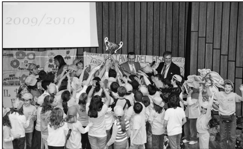
Un momento della premiazione.