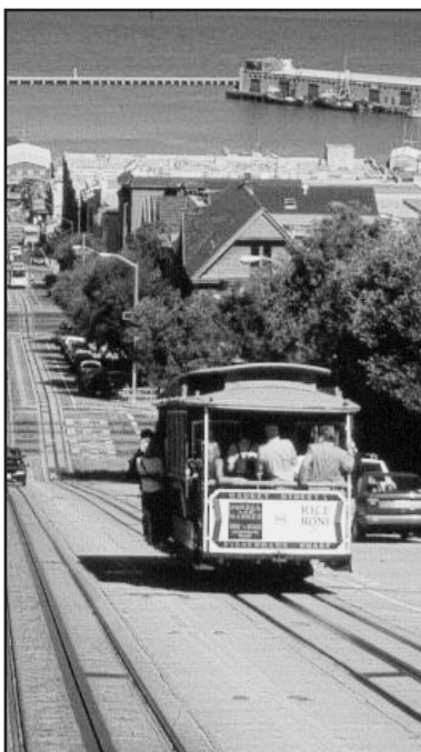
Il caratteristico tram urbano a cremagliera sulle strade a saliscendi di San Francisco.

vie del mio paese, osservando i volti delle persone che mi circondano. I visi tristi o seri hanno avuto la maggiore, di visi sorridenti ce n'erano alcuni, ma di visi felici non ne ho mai veramente visti. Non so se sbaglio, ma ho sempre avuto l'impressione di riuscire a capire dallo sguardo di una persona se sia realmente felice o meno. Lo capisco dal modo in cui corruga la fronte, dalla piega che prendono i suoi occhi e gli angoli della bocca quando parlo. Sono piccoli dettagli che cerco sempre di cogliere.